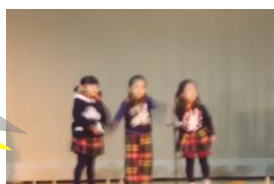
オープニングは 合唱と合奏