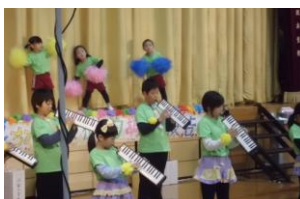
温泉のアイドル! 3人組!

今年は最後の発表会ということで、皆さんにいい気持ちになって喜んでもらおうと、「がんばろう温泉! 私たちの大好きなふるさと」のテーマのもと、自分たちの気持ちを伝えようと、どの発表も一生懸命に取り組みました。多くの方から「感動しました」「少ない人数でよくやりましたね。みんなが主役でしたね」「私たちも勉強になりました」「木次へ行っても大丈夫ですね」「みんなの気持ちが伝わってきました」等の声をかけていただきました。ありがとうございました。