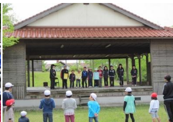
「ゲームの中で校歌を紹介」